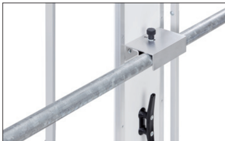
Einfache Gerüstmontage für leichtes Versetzen auf dem Gerüst