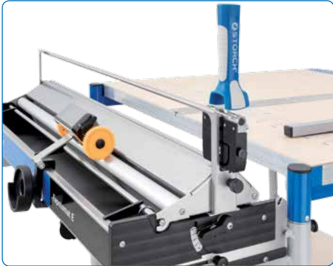
Kompatibel mit allen STORCH Tapetomat E-Modellen.