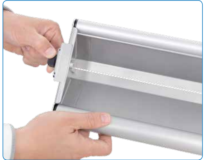
Einfache, werkzeuglose Montage durch Nutzung hochwertiger Verbindungskomponenten.