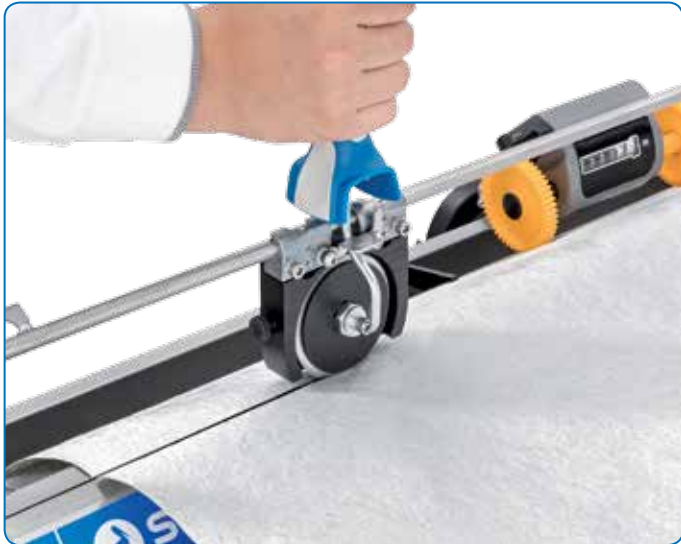
Genaueres Ablängen durch präzise Führung.