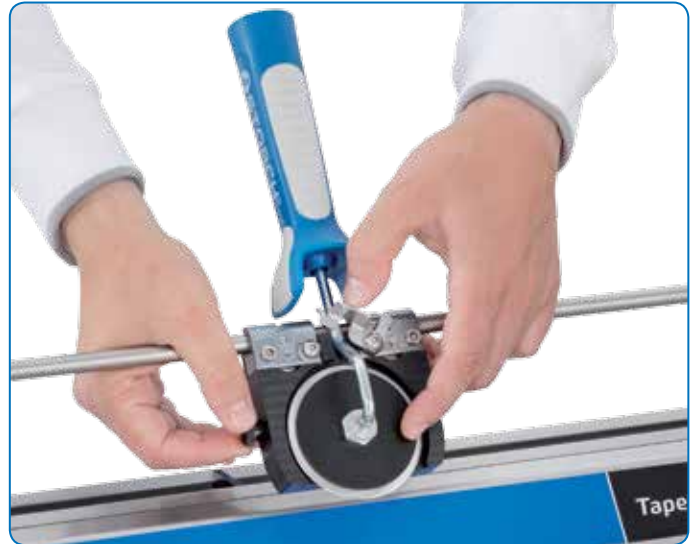
Schnelles und ergonomisches Arbeiten durch 2K-Griff mit Softgrip.