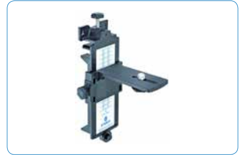
Wandhalterung mit 5/8" Stativgewinde