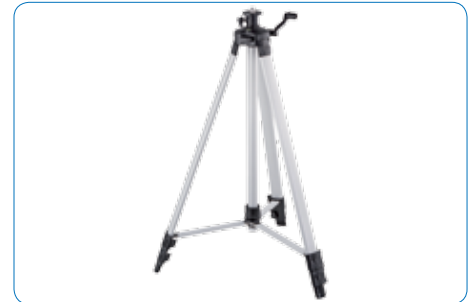
Stativ bis 1,8 m Höhe mit 5/8" Stativgewinde