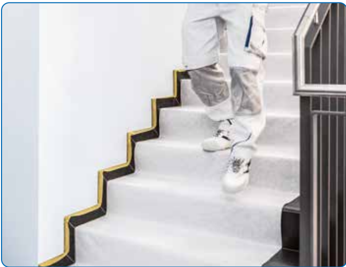
Extra hohe Trittsicherheit auf Treppen.