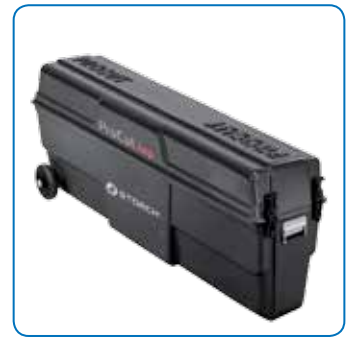
Robuster Kunststoff-Transportkoffer mit Rollen