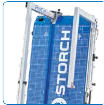
Eckschneider am Rücken anklappbar