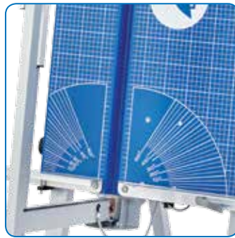
Gut ablesbare Messskalen für rationellere Zu- und Wiederholungsschnitte